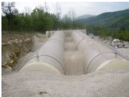
Obr. Výstavba vodojemu

Zásobovanie pitnou vodou sa uskutočňuje z vlastných studní a skupinových vodovodov. V obci Hatné nie je vybudovaná verejná kanalizácia ani rozvodná sieť plynu.