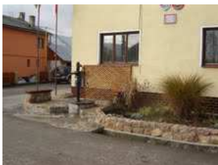
Obr. Obecný úrad a zrekonštruovaná studňa