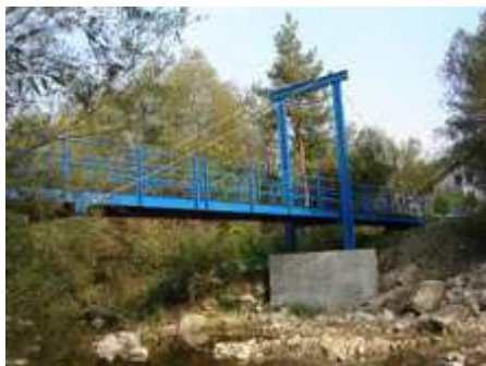
Obr. Lávka v obci Hatné