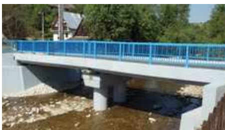
Obr. Most v obci Hatné