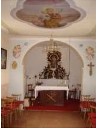
Obr. Kaplnka Sv. Jozefa

evanjelický kostol v Hatnom, zasvätený Sv. Matejovi. Po prevzatí panstva Žigmundom Balaššom prestúpila väčšina obyvateľstva na katolícku vieru. Po zhorení kostola postavili na jeho mieste malú murovanú kaplnku Sv. Jozefa., ktorá stojí dodnes.